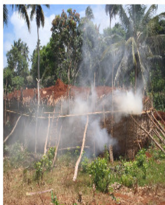
Charbonnière en combustion

Bilan 1er semestre 2015 de la lutte contre le charbonnage illégal. 16 charbonnières détruites situées principalement dans le nord de l'île, secteur de Dzoumonyé sur la commune de Bandraboua. 44% sur des parcelles privées / 56% sur des parcelles du conseil départemental Volume total de 453 m3 / valeur estimée 36240 euros (80euros/m3) Essence d'arbre concerné : avocat marron / bois noir