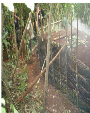
Intervention DAAF/ PSIG