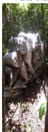
Conditionnement en sacs: 20 euros l'unité