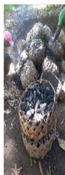
Conditionnement en corbeilles: 7 euros l'unité